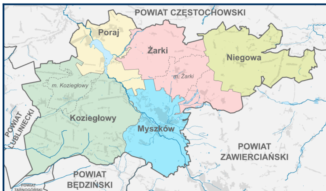
Mapa administracyjna powiatu myszkowskiego